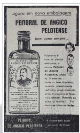
Publicidade antiga do Remédio citado por Ângelo.