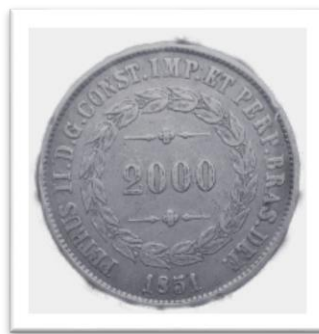
Imagem de moeda de prata de 2.000 réis do ano de 1851.

– Ontem vendi ao neto Angelin, filho do genro Maximino, uma coleção de moedas estrangeiras, sendo de 54 sortidas, e uma do império do Brasil de prata, no peso de 25 gramas de 2.000 réis, emitida no ano de 1851. Eu pelas moedas lhe pedi Cr$ 200,00 e ele ofereceu-me Cr$ 250,00.