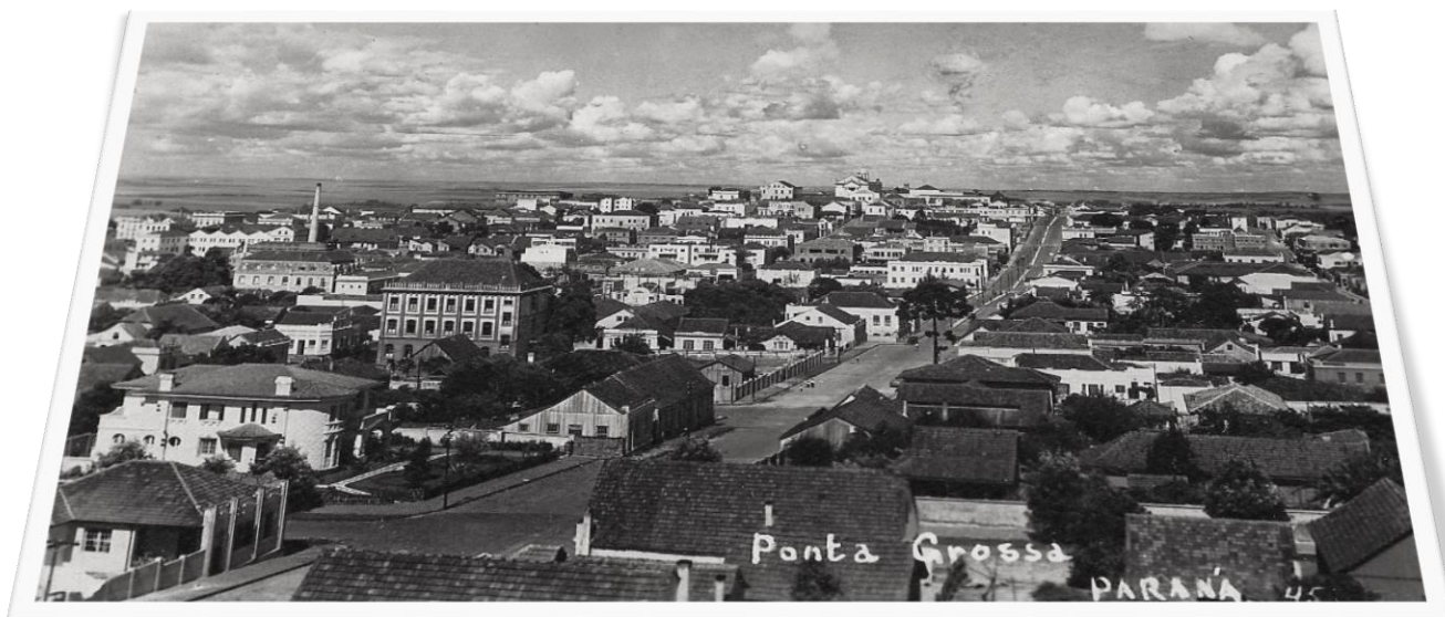
A pacata Ponta Grossa dos anos 50, o convívio entre as carroças e o automóvel. À esquerda a estação ferroviária e à direita a Praça João Pessoa.